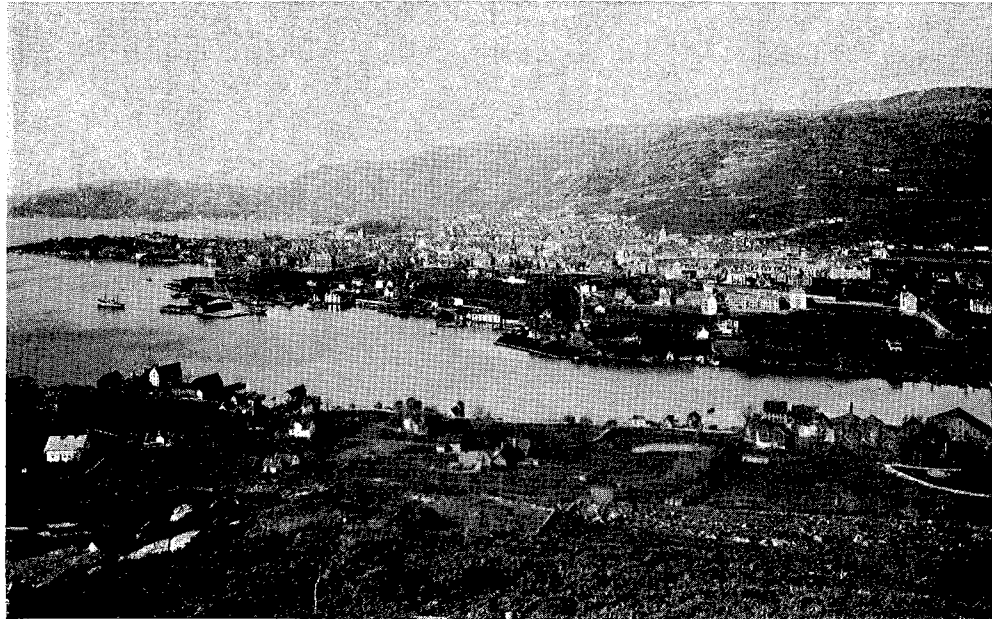
Fra Damsgårdsiden hvor plantingen begynte.

60 skilling pr. favn, (ca. kr. 2,— pr. 2 meter). Steingjerde som i tilfelle måtte gis en høyde av 10/4 alen med glatt utside mente man å kunne få for samme pris. Da selskapets midler på angjeldende tidspunkt var meget beskjedne fremkom forslag om å søke Statens Forstvæsen og Det Nyttige Selskab om tilskudd.