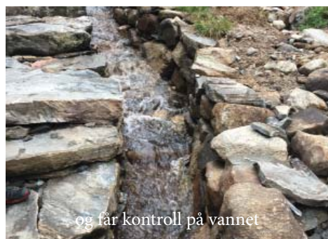
og får kontroll på vannet