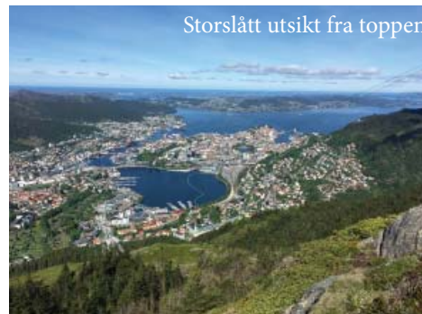
Storslått utsikt fra toppen