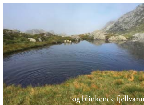
og blinkende fjellvann

Ulriken er Bergens Nasjonalfjell Nystemten er Nasjonalsangen Oppstemten blir Nasjonalstien til topps i 2018