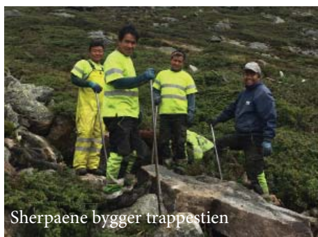
Sherpaene bygger trappestien